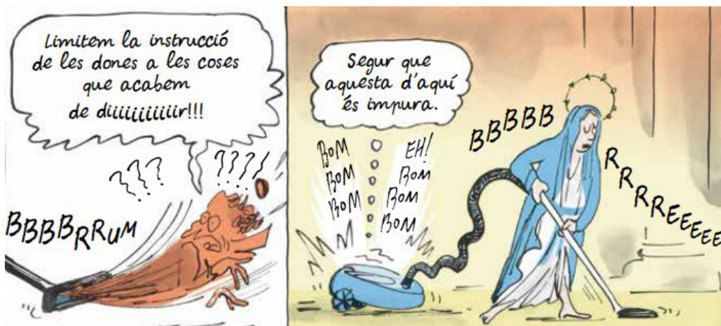
Fénelon, filòsof (1651-1715)

“La dona, com a bona ànima cristiana s’ha d’encarregar de l’educació dels seus fills, dels nois fins a certa edat, de les noies fins que es casin o es facin religioses, de la conducta dels criats, de vigilar les despenses. Una dona correcta és una dona que no llegeix. La dona que sap llegir un tiquet de caixa o el manual de l’aspiradora és impura, però pot resultar útil.”