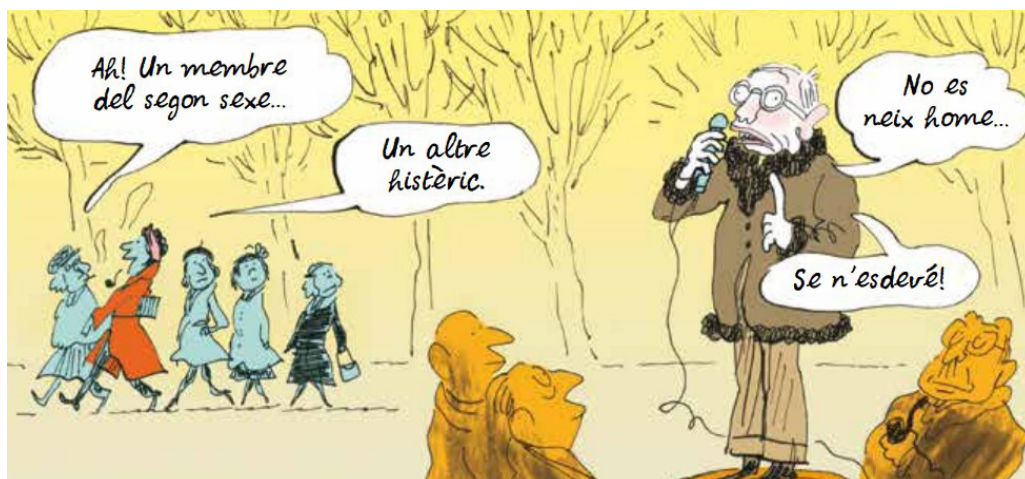
Simone de Beauvoir, novel·lista i filòsofa (1908-1986)